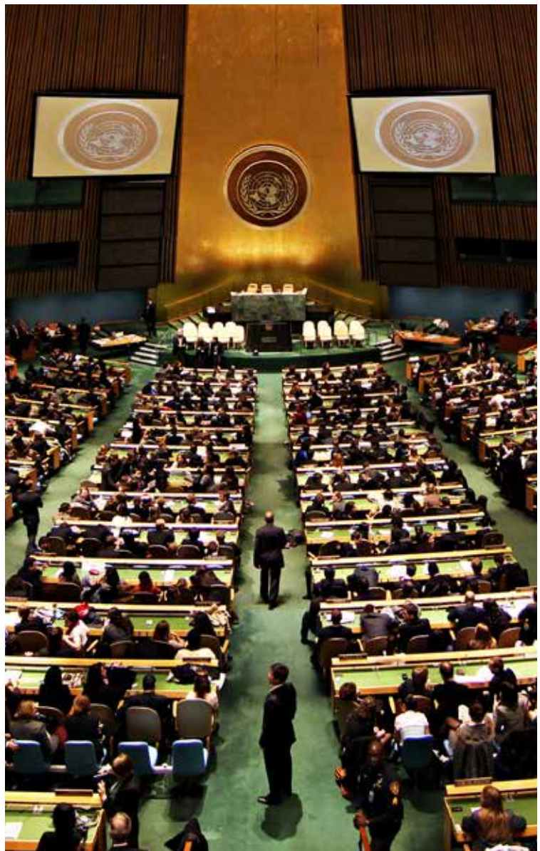
BASIL D SOUFI

Ein Fragment der Schriftrollen vom Toten Meer, die im Jahre 1947 und in den folgenden Jahren entdeckt wurden. Die zwei Tonbehälter bewahrten die Dokumente fast 20 Jahrhunderte lang. Unter den Schriftrollen befanden sich Fragmente der Bibel in hebräischer Sprache, die mit dem heutigen Text so gut wie identisch sind. Ist dieser alte Text tatsächlich relevant in unserem modernen Informationszeitalter?