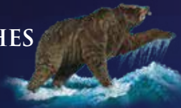
Daniel 7, 5

2. Haupt des prophetischen Babylons 558-330 v. Chr.