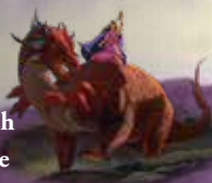
Offenbarung 17, 3

(Die ersten drei Hörner wurden nicht von der Frau geritten und auf Geheiß des Papstes zerstört) (Kleines Horn, Daniel 7, 8, 20-22, 24-27)