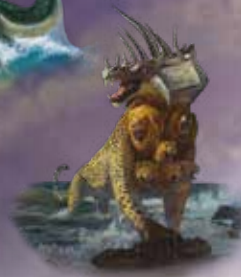
Offenbarung 13, 1-2