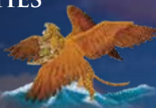
Daniel 7, 6

3., 4., 5., und 6. Haupt des prophetischen Babylons 333 v. Chr.