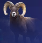
Daniel 8, 3-4, 20