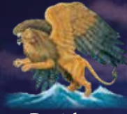
Daniel 7, 4

1. Haupt des prophetischen Babylon 625-538 v. Chr.