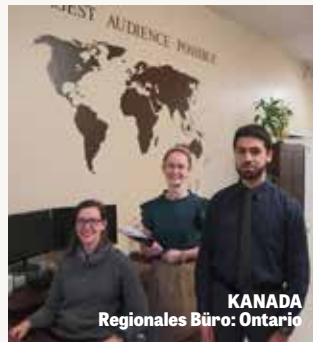
KANADA Regionales Büro: Ontario

Die Mitarbeiter und Prediger des Regionalbüros in Kanada werben für Der Schlüssel Davids und die Philadelphia Posaune und kümmern sich um die Mitglieder, die über Tausende von Quadratkilometern verstreut sind. Das Büro bearbeitet die Post und andere Literaturanfragen und unterstützt die Zentrale bei Übersetzungen, Online-Marketing und anderen Aufgaben.