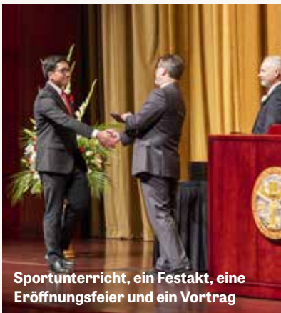
Sportunterricht, ein Festakt, eine Eröffnungsfeier und ein Vortrag