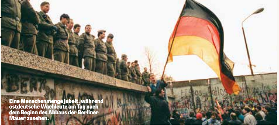
Eine Menschenmenge jubelt, während ostdeutsche Wachleute am Tag nach dem Beginn des Abbaus der Berliner Mauer zusehen.

Dramatische Weltereignisse, die in der biblischen Prophezeiung vorhergesagt wurden – wie (von links) der Fall der Berliner Mauer 1989, Großbritanniens Entscheidung, die Europäische Union 2016 zu verlassen, und Donald Trumps wunderbares knappes Verfehlen der Kugel eines Attentäters – werden in der kommenden Zeit mit Sicherheit häufiger auftreten.