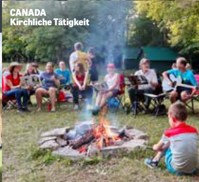
CANADA Kirchliche Tätigkeit