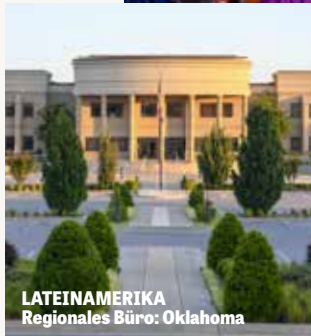
LATEINAMERIKA Regionales Büro: Oklahoma

Die Region Lateinamerika wird vom Hauptsitz aus geleitet, wobei der Regionaldirektor zu den verstreuten Mitgliedern in ganz Südamerika reist und die Übersetzungsabteilung der Kirche leitet. Die Übersetzer in der Zentrale produzieren eine große Menge an spanischsprachigen Inhalten, und der Regionaldirektor koordiniert mit Mitarbeitern in Edstone und Kanada sowie zahlreichen Freiwilligen die Übersetzungen in neun weiteren Sprachen.