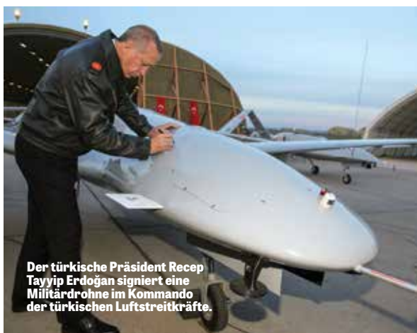
Der türkische Präsident Recep Tayyip Erdoğan signiert eine Militärdrohne im Kommando der türkischen Luftstreitkräfte.

In meinem Artikel über Syrien aus dem Jahr 2012 schrieb ich: „Amerika war zu schwach, um den Iran zu zähmen und seine Verbündeten zu neutralisieren, aber Deutschland rückt an und