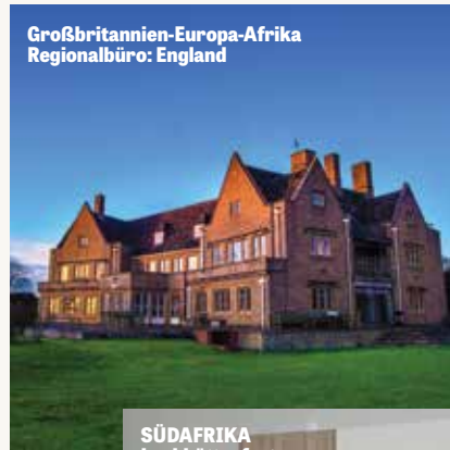
Großbritannien-Europa-Afrika Regionalbüro: England