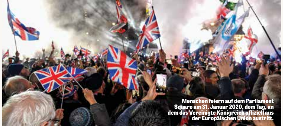
Menschen feiern auf dem Parliament Square am 31. Januar 2020, dem Tag, an dem das Vereinigte Königreich offiziell aus der Europäischen Union austritt.

Gott befahl Jesaja, seine Prophezeiungen aufzuzeichnen: „So geh nun