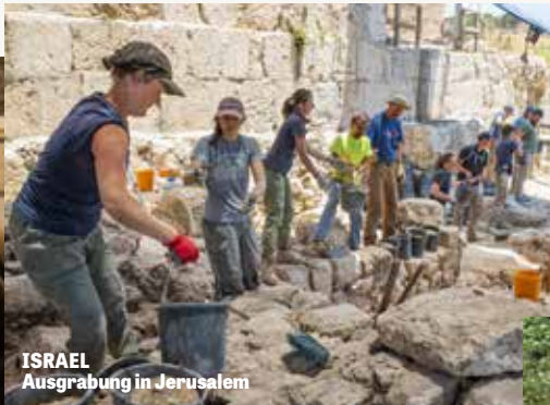
ISRAEL Ausgrabung in Jerusalem