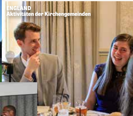
ENGLAND Aktivitäten der Kirchengemeinden