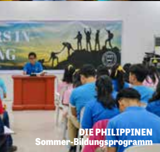
DIE PHILIPPINEN Sommer-Bildungsprogramm