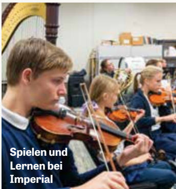
Spielen und Lernen bei Imperial