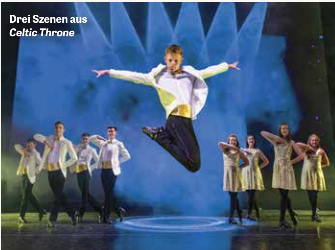
Drei Szenen aus Celtic Throne