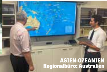
ASIEN-OZEANIEN Regionalbüro: Australien