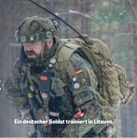
Ein deutscher Soldat trainiert in Litauen.

V OR DREI JAHREN BEGANN Russland seine groß angelegte Invasion in der Ukraine. Seitdem hat der Konflikt jeden Tag auf der ganzen Welt für Schlagzeilen gesorgt. Aber in den Tausenden von Artikeln über den Konflikt ist die wichtigste Entwicklung weitgehend ignoriert worden.