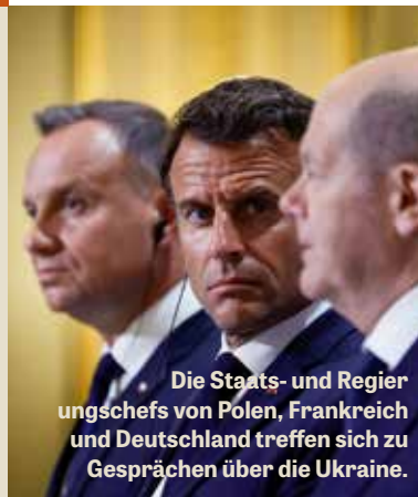
Die Staats- und Regierungschefs von Polen, Frankreich und Deutschland treffen sich zu Gesprächen über die Ukraine.

Seit ihrer Gründung im Februar 1990 stützt sich die Philadelphia Posaune auf biblische Prophezeiungen, um ihren Lesern heute die Nachrichten von morgen zu bringen. Hier sind 10 der jüngsten erfüllten Prophezeiungen aus den letzten 35 Jahren.