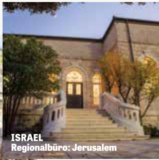
ISRAEL Regionalbüro: Jerusalem