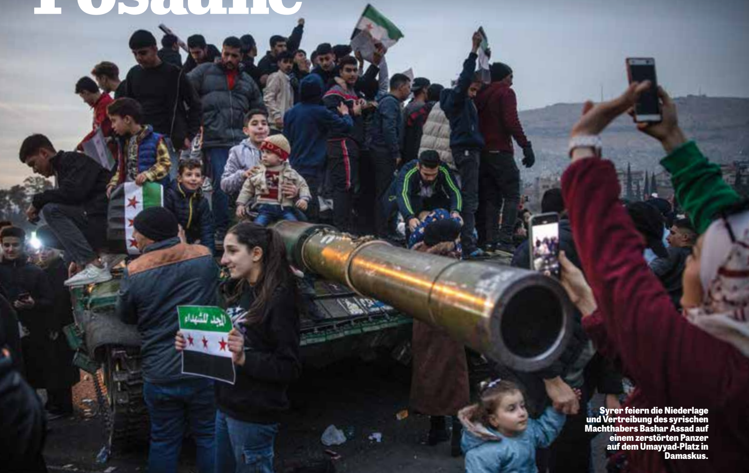
Syrer feiern die Niederlage und Vertreibung des syrischen Machthabers Bashar Assad auf einem zerstörten Panzer auf dem Umayyad-Platz in Damaskus.